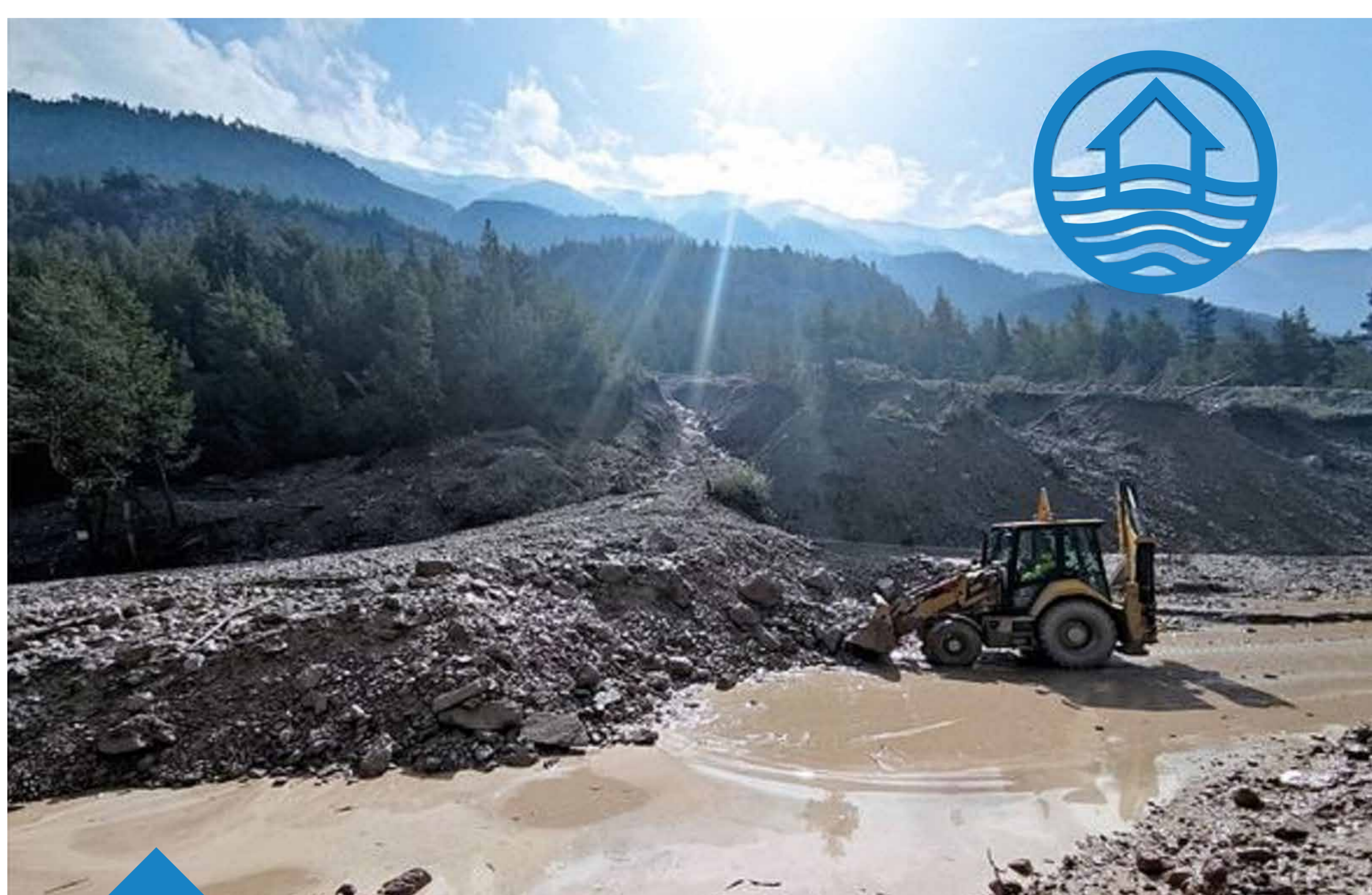
2019 > Laves torrentielles en Clarée (Vue aval)