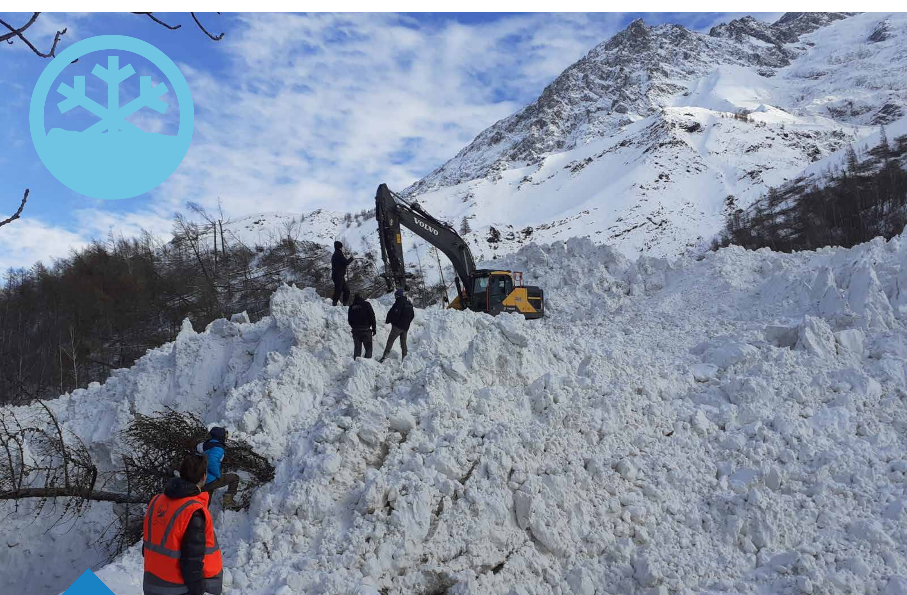
2021 > Avalanche - La Grave

Illustrations aléas avalanche et inondation en montagne