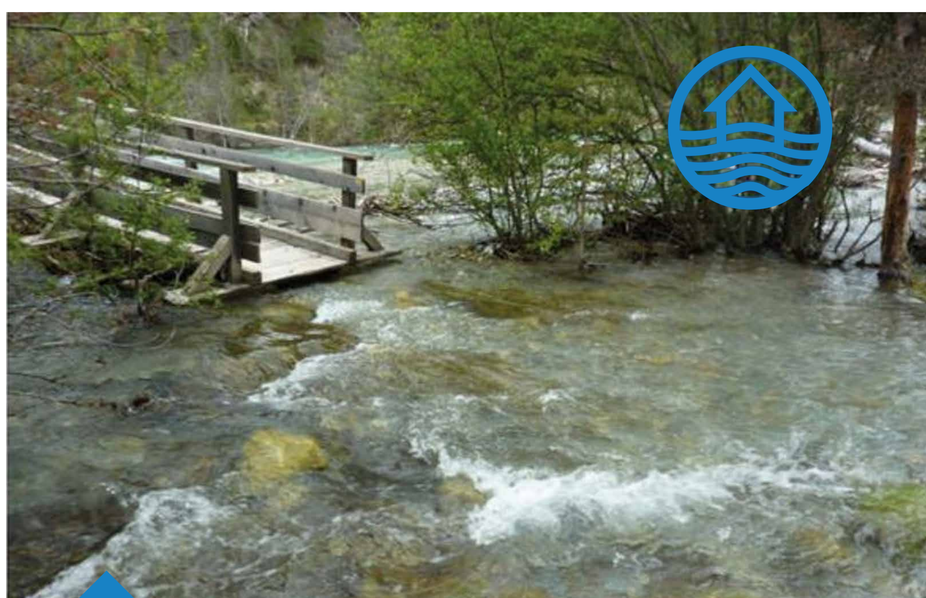
2020 > Inondation - Clarée