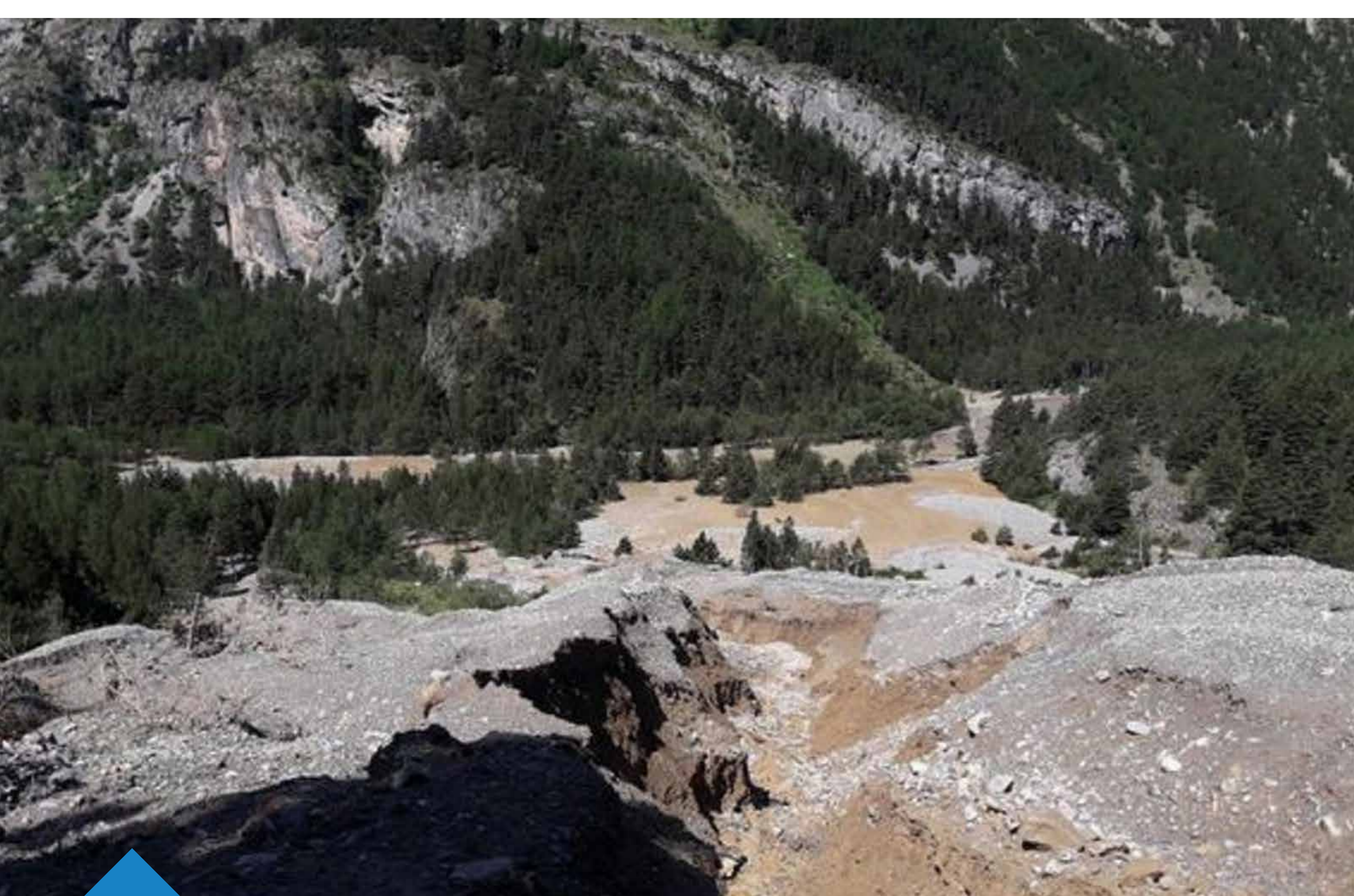
2019 > Laves torrentielles en Clarée (Vue amont)