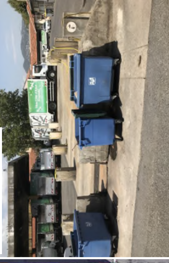
0 25 50 m