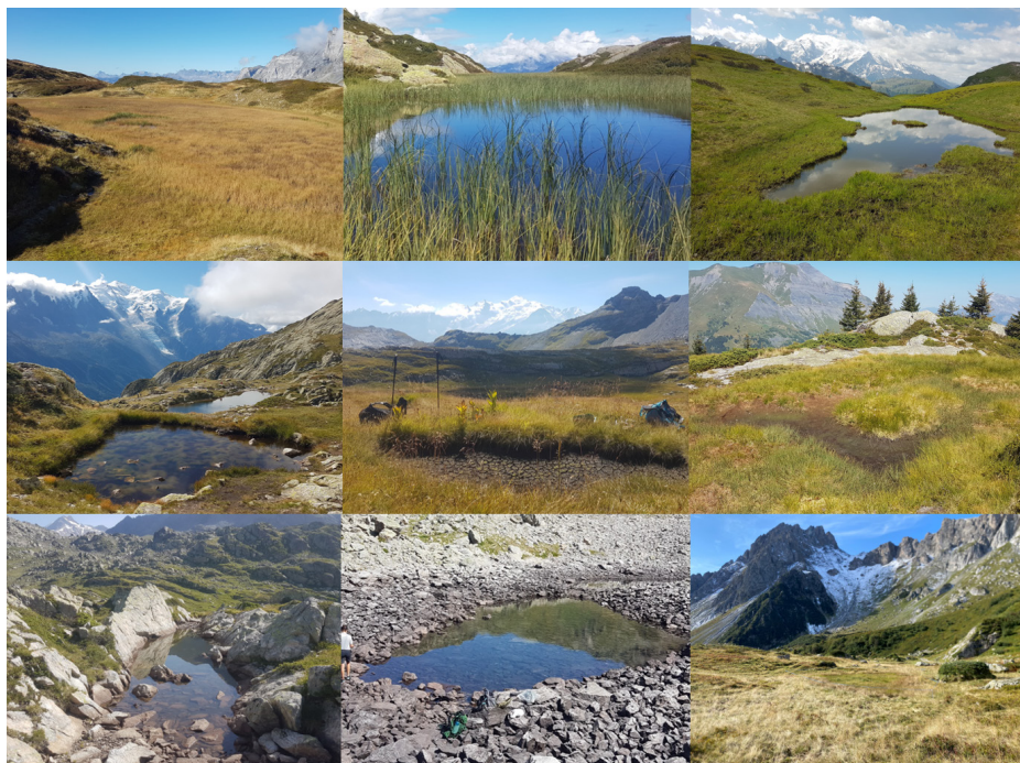
Quelques photos de pièces d'eau de moins de 0.5ha dites « mares »

Pour mieux permettre de se rendre compte de quoi il est sujet ici, quelques illustrations des pièces d'eau de moins de 0.5ha. Il n'existe aucune limite inférieure de surface ou de profondeur.