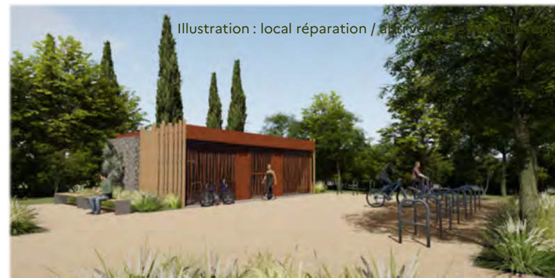
Illustration : local réparation / arrivée

Illustration : bâtiment des sanitaires de l'aire de repos